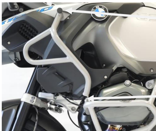
Šroub M8x40 Podložka M8 Plastová krytka