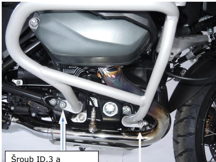
Šroub ID.3 a podložka ID.4.