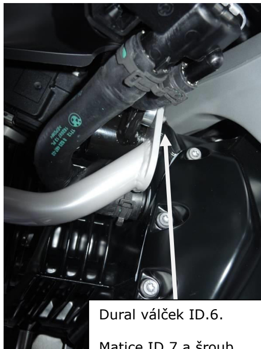
Dural váleček ID.6.